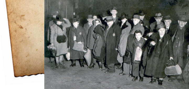
10.12.1941 Deportation Coesfelder Juden nach Riga

Buchung kult@kreis-borken.de oder Tel (02861) 681 1415